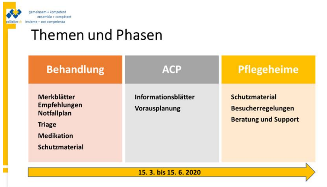
Tabelle 1: Themen und Phasen der Task Force Corona

Phase 1: In der ersten Phase ging es um settingspezifische Therapien, um Medikation, Behandlung und Betreuung, um Entscheidungsfindung und um intraprofessionelle Empfehlungen. Auch die Verfügbarkeit von Schutzmaterial – insbesondere für Freiwillige sowie in den Pflegeheimen – waren ein Thema. Fragen an die Task Force aus dieser Phase behandelten vorwiegend Dosierungsempfehlungen, alternative Verabreichungsformen sowie alternative Medikationsempfehlungen bei Medikamentenengpässen. Auch die Nachfrage nach Schutzmaterial wurde deponiert.