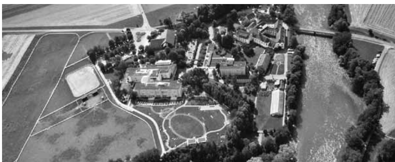
Übersicht über die gesamte Anlage

Der Reusspark besteht aus zwei sehr unterschiedlichen Gebäudekomplexen. Dem ehemaligen Zisterzienserinnen-Kloster, in dem seit 1894 pflegebedürftige Menschen betreut werden und dem neu renovierten, hellen Hauptgebäude aus dem Jahre 1977, in dem heute 164 der 234 Bewohner leben. Die häufig stattfindenden Anlässe, sowie die parkähnliche Anlage mit Tiergarten und Kinderspielplatz ziehen viele Besucher und Ausflügler an.