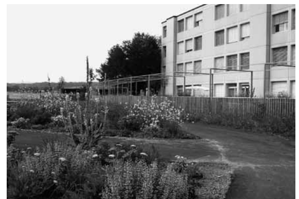
Bildlegende: Blick aus dem «Garten der Sinne» auf das Hauptgebäude

Neben den klassischen Pflegewohnbereichen für chronisch kranke Menschen schuf sich der Reusspark in der Betreuung dementiell erkrankter Personen eine Kernkompetenz. So gibt es von der Wohngemeinschaft für Demente im Anfangstadium bis zur geschützten Demenzstadium für mobile, weglaufgefährdete Bewohner kleinere und grössere Wohnbereiche passend zum jeweiligen Demenzstadium. Im vergangenen Jahr kam als weitere Qualitätssteigerung der sogenannte «Garten der Sinne» hinzu. Eine geschützte Gartenanlage von rund 90 Aren Land ermöglicht desorientierten, bewegungsorientierten Menschen ein Stück Freiheit und wohlthuende Sinneseindrücke. In dieser Grosszügigkeit ist der Garten schweizweit einzigartig.