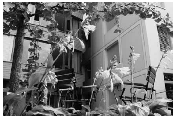
Ein Blick aus dem Innenhof auf das helle und grosszügig gebaute Hauptgebäude

Obwohl die Begleitung bis zum Tod seit jeher einen wichtigen Stellenwert in der Pflege chronisch kranker Menschen hat, will man mit der Palliativstation ein Zeichen setzen. Denn die Betreuung sterbender Menschen ist in der Gesellschaft noch immer Tabuthema. Der Reusspark will dem entgegenreten, in dem er die Sterbebegleitung zu einem zentralen Aufgabengebiet entwickelt.