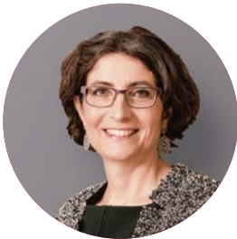
Manuela Weichelt Präsidentin

MPH, BLaw, Nationalrätin Mitglied SGK-NR