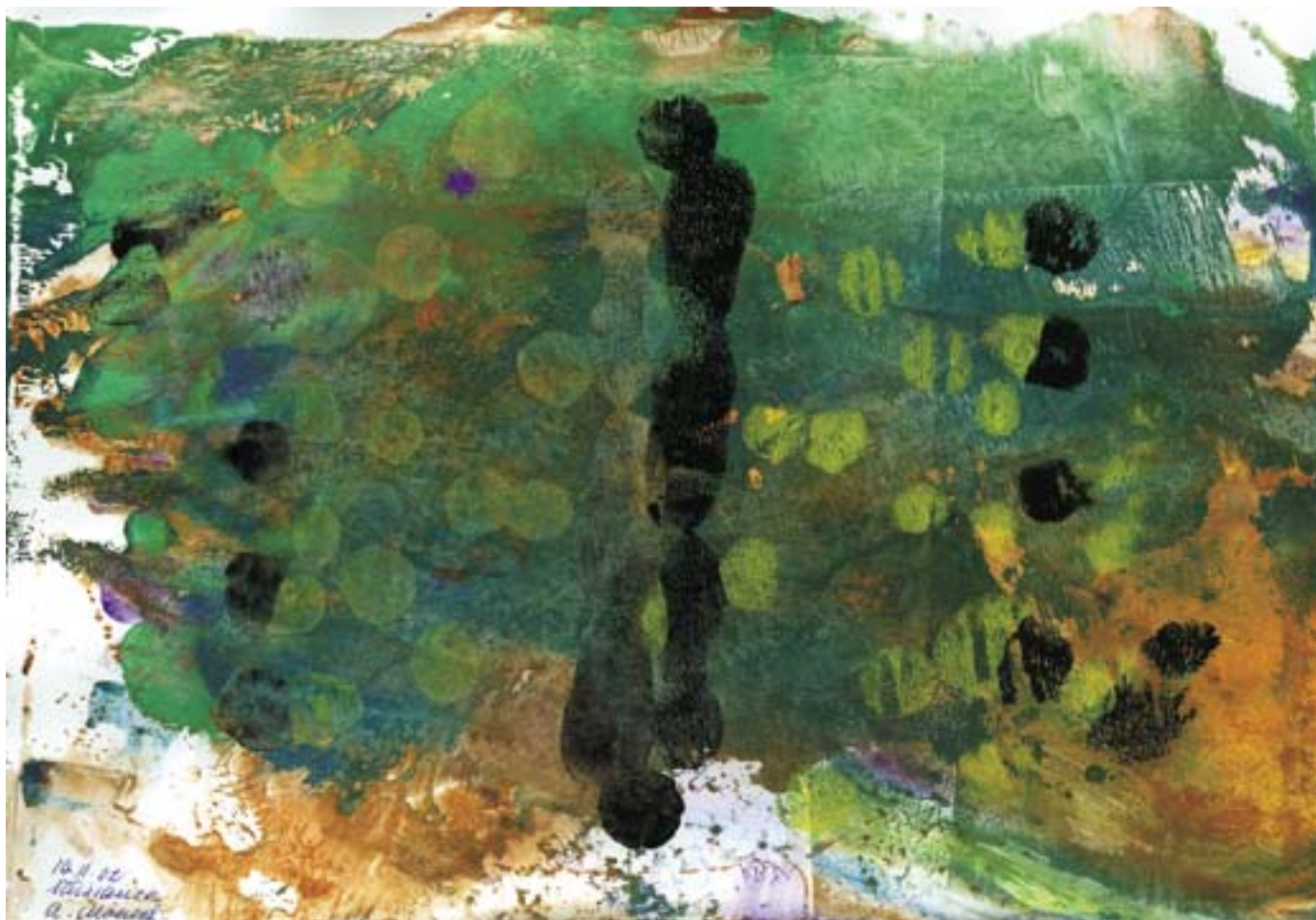
«Reconnaissance» œuvre d'un participant à l'atelier reproduit avec autorisation.

aire du jeudi avec l'ensemble de l'équipe soignante. Les chemins empruntés par les personnes malades approchées à travers un art, trouvent alors toute leur reconnaissance.